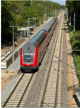
RE 1 nach Rostock