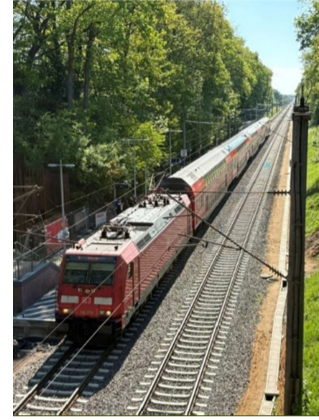
RE 1 nach Hamburg